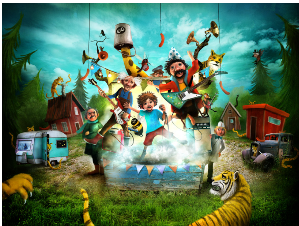
Illustration: Alexander Jansson